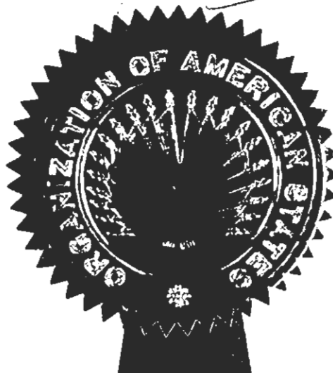
César Gaviria Trujillo César Gaviria Trujillo Secretario General de la OEA

POR SECRETARÍA GENERAL DE LA ORGANIZACIÓN DE LOS ESTADOS AMERICANOS